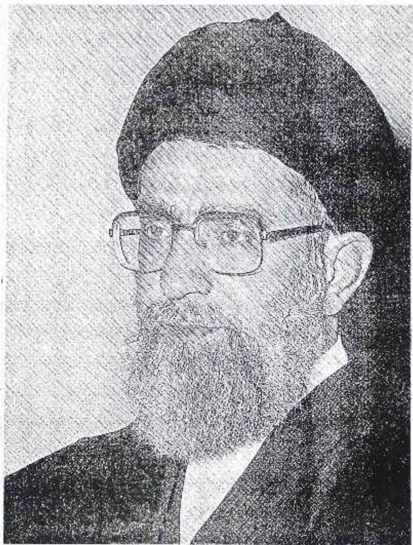
مقام معظم رهبری حضرت آیت الله سید علی خامنه ای